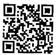
ไปรษณีย์ Privacy Notice เพิ่มเติม เพียงสแกน QR Code

10. คิววมหาวิทยาลัยอุบลราชธานีได้แจ้งประกาศความเป็นส่วนตัว (Privacy Notice) ด้านข้อมูลส่วนบุคคล ของผู้สมัครงาน ให้ข้าพเจ้าทราบแล้วก่อนที่ข้าพเจ้าจะให้ข้อมูลส่วนบุคคลตามใบสมัครฉบับนี้ ข้าพเจ้าได้ อ่านประกาศความเป็นส่วนตัวดังกล่าว และเข้าใจประกาศดังกล่าวเป็นอย่างดีแล้ว